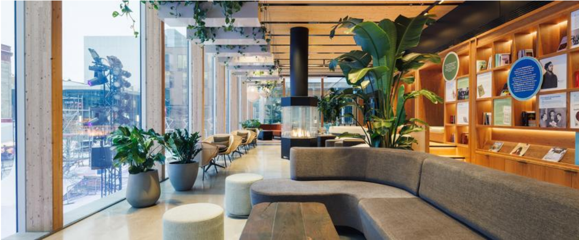
Le Grand Salon du pavillon de l'esplanade Tranquille

Les visiteurs sont invités à découvrir le pavillon de l'esplanade Tranquille adjacent à la patinoire. Ouvert tous les jours, cet espace conçu par les architectes FABG comprend de nombreuses salles à vocations multiples dont le design intérieur est signé Zébulon Perron .