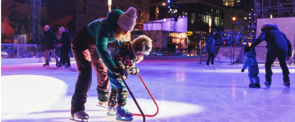
Patinoire de l'esplanade Tranquille

Jusqu'à la fin de l'hiver, les dimanches de 10 h à 13 h, les enfants et leurs familles sont invités à découvrir Jardin de glace , un espace ludique sur la patinoire destiné à l'apprentissage du patin. Les instructeurs de Patin Patin sont sur place avec des mini-zambonis et du matériel pédagogique pour encourager les petits de 2 à 10 ans à apprendre en s'amusant. Aucune réservation requise.